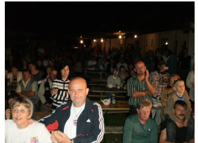
Sokan voltunk éjszaka is