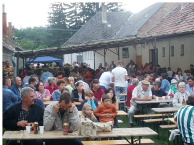
A Tisztelt Nagyerdemű