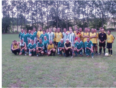
Ajka - Bakonypéterd csapatai