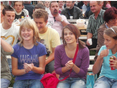
A fiatalok is jól szórakoztak