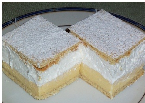
Nagyon finom, könnyű sütemény!

Az egészben hagyott lapot tegyük egy tálcára, kenjük rá a sárga krémet, erre tegyük a felvert tejszínhabot, majd helyezzük rá a felvágott tésztalapokat, és porcukorral megszórva tálaljuk.