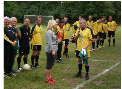
Emlék mez átadás