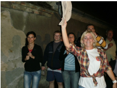
Jó volt a hangulat